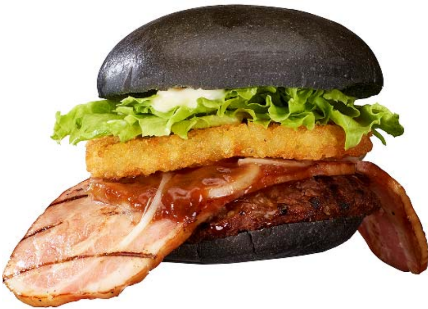
『黒 NINJA(KURO NINJA)』