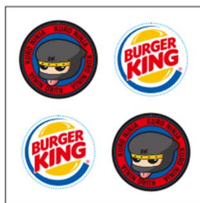
『黒 NINJA』キャラクターロゴシール

『黒 NINJA』ドリンク M コンビ以上をお買い上げのお客様に数量限定で『黒 NINJA』キャラクターのロゴシールをもれなくプレゼントいたします。 ※なくなり次第終了。