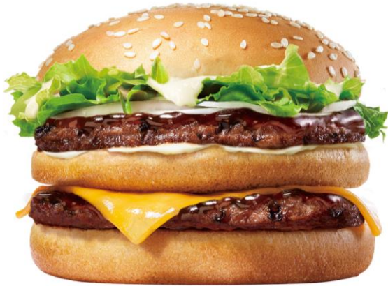
『TERIYAKI BIG KING™』

株式会社バーガーキング・ジャパン(本社:東京都渋谷区、代表取締役社長:村尾 泰幸、以下:BKJ)は、『BIG KING™(ビッグキング™)』の新商品として、『TERIYAKI BIG KING™(テリヤキ ビッグキング™)』、『CHICKEN BIG KING™(チキン ビッグキング™)』を2015年12月18日(金)から期間限定で、バーガーキング®(以下:BK)全店にて発売いたします。