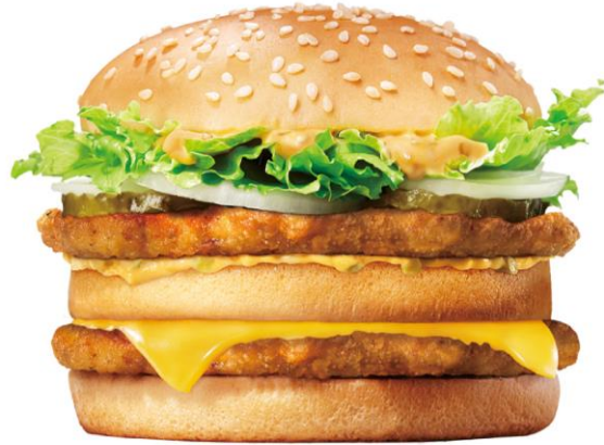
『CHICKEN BIG KING™』

BKJは、2015年11月6日(金)よりBK全店で『BIG KING™4.0』と『BIG KING™5.0』を販売しており、直火焼きの“違い”が分かるハンバーガーとして大変ご好評いただいております。