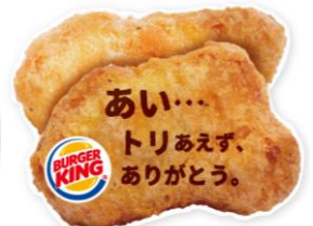
※クーポンイメージ(表面)