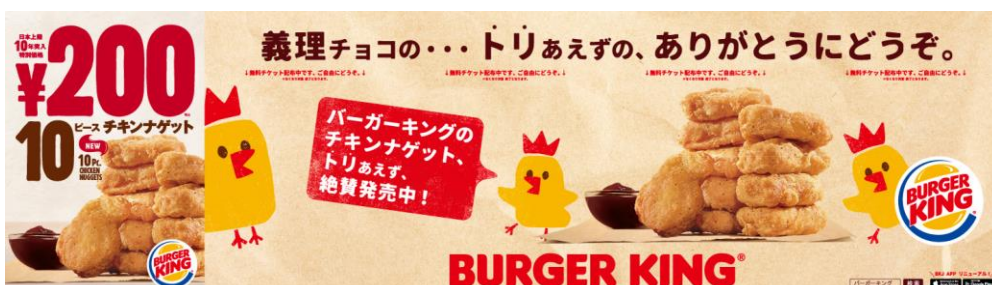
※ピールオフ広告イメージ(クーポンなし)